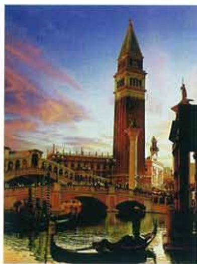
Só o hotel do Venetian tem 3 mil quartos. Nos primeiros 17 dias recebeu 1 milhão de visitantes. A suite real custa 3500 euros por noite

M acau – em chinês Ou Mun – cheira a dinheiro e tem o som das moedas a cair das slot machines . Os casinos inebriam esta economia que enriqueceu após 2002, com o fim do monopólio do jogo. As receitas desta actividade subiram 46,6%, em 2007. E os especialistas do sector dizem que o crescimento será de 20% a 30% em 2008. David Green, consultor de casinos da PricewaterhouseCoopers, diz que crescimentos desta escala darão a Macau mais do que as receitas de jogo de Las Vegas e Reno, no Nevada (que foram 8,7 mil milhões de euros, em 2007). “Isso fará com que se torne o mais importante território de jogo do mundo.” E avança: “Com a abertura dos casinos norte-americanos, a vinda de muita gente que antes não frequentava Macau e do segmento VIP, no seu conjunto, vão crescer.”