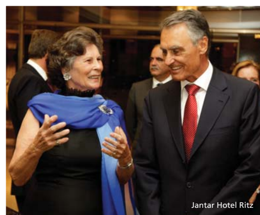
Jantar Hotel Ritz