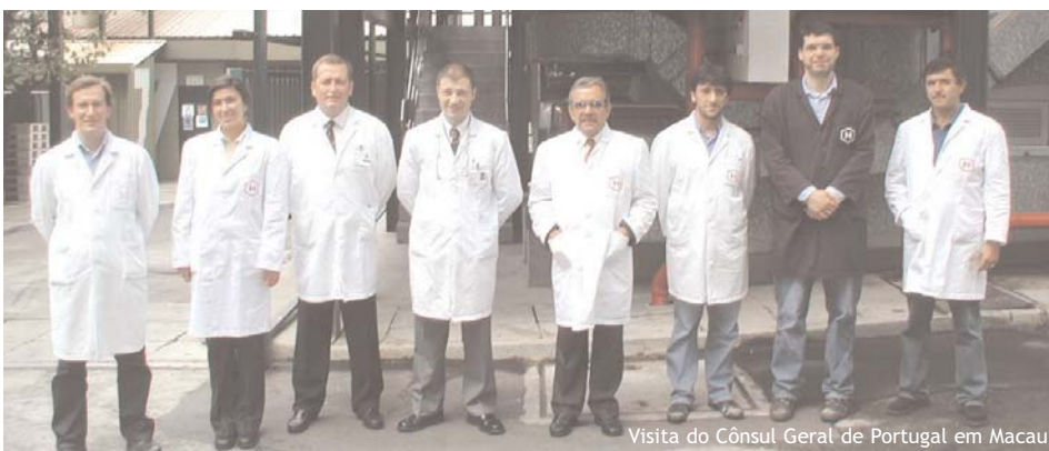
Visita do Cônsul Geral de Portugal em Macau