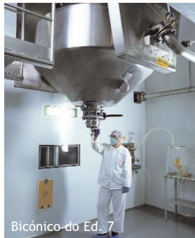
Bicónico do Ed. 7

Também em Abril, foi estreado o novo secador bicónico. Com este equipamento é agora possível secar e misturar, sendo as descargas executadas em sistema fechado, para os processos que assim o exijam. Verdadeiramente inovadora é a instalação do secador bicónico, suspenso do tecto, em vez dos clássicos apoios sobre o chão, o que permite dispôr de um amplo espaço de trabalho no interior da sala. Os equipamentos utilizam o sistema de automação DELTA-V, permitindo, também aqui, um ganho em reprodutibilidade, rigor de execução e qualidade dos registos, e posterior recolha de dados, muito úteis para tratamento.