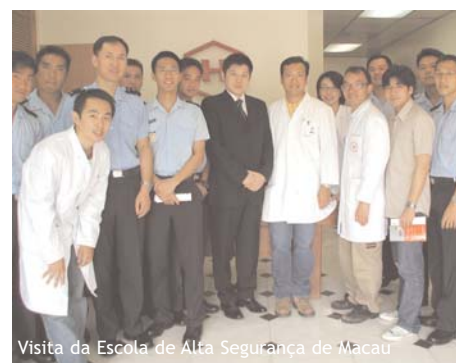
Visita da Escola de Alta Segurança de Macau

No princípio de Março, tiveram início as obras para uma nova ligação dos esgotos. Esta ligação vai permitir que a HM envie directamente o seu efluente aquoso para a entidade oficial “Taipa Waste Water Treatment”, evitando a descarga num sistema sub-dimensionado, utilizado também pelos seus vizinhos.